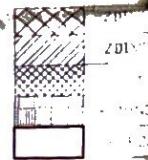
DETAIL 1: VYZTUŽENÍ SLOPŮ U BAZENU 125